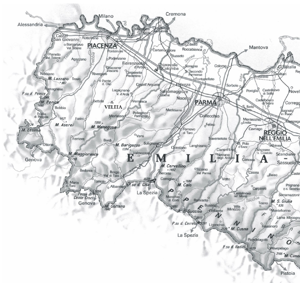
L'Emilia occidentale: rielaborazione grafica di Luca Lanza 5

Su questo aspetto la bibliografia è inarrestabile, a volte ripetitiva e francamente inutile: una rassegna per quanto possibile esaustiva dei lavori che interessano Veleia e l'ager Veleias, si trova in Dalla "Tabula alimentaria" all'ager Veleias: bibliografia veleiate , che pubblico annualmente in "Ager Veleias" [ www.veleia.it ].