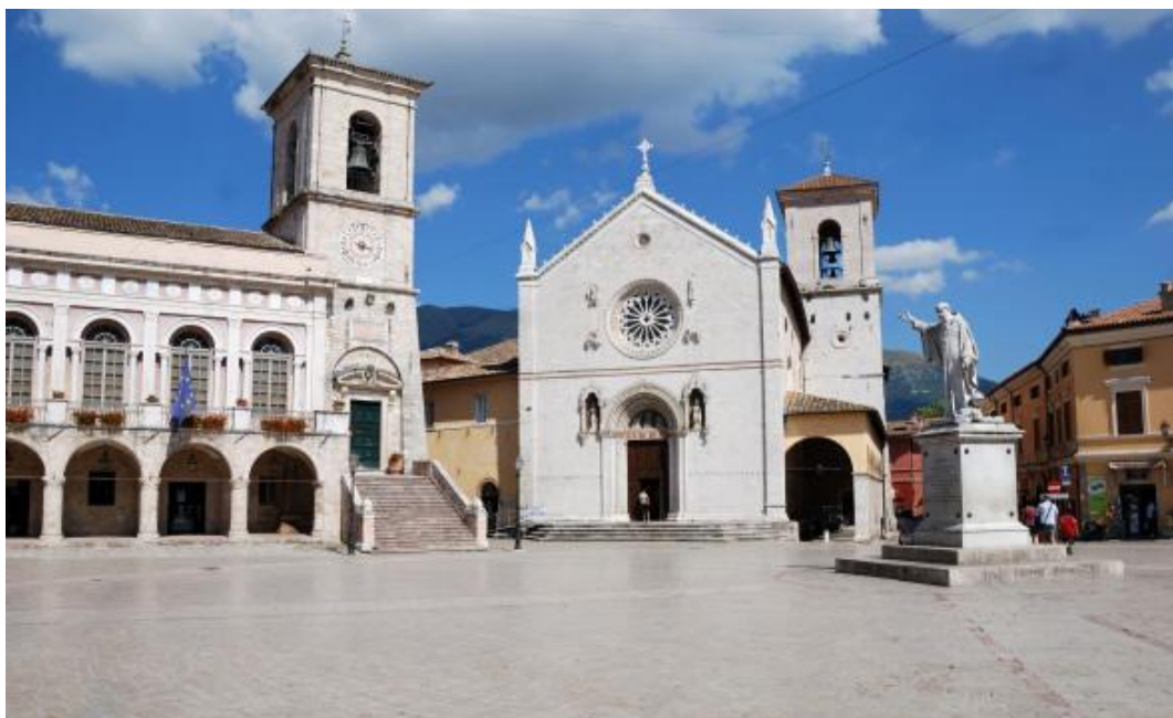
[Palazzo Comunale e Basilica di S. Benedetto (prima dei sismi del 24.8 e 26-30.10 2016)]

Nella fase finale, come è stato più volte ufficialmente dichiarato e come si spera vivamente che avvenga, questo patrimonio ora come ora "esodato" dovrà fare naturalmente ritorno ai luoghi di origine. Conditio sine qua non , quest'ultima, perché non venga ulteriormente ferita l'identità già profondamente compromessa di un territorio tanto ricco di beni culturali, quanto ciclicamente esposto a emergenze naturali e a massicce spoliazioni patrimoniali.