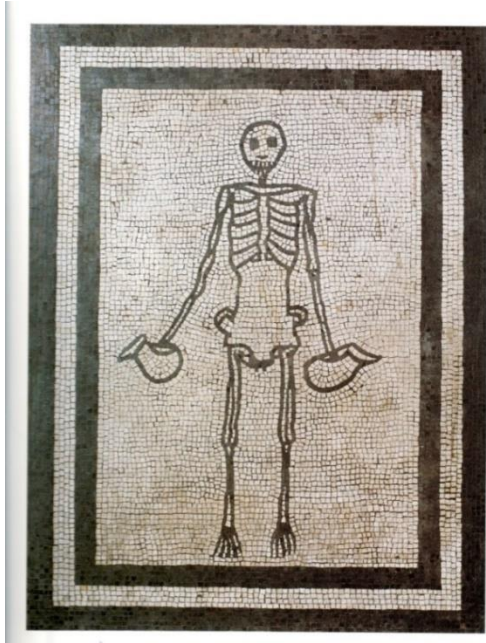
Mosaico tricliniare, Pompei, ante 79 d.C. (Museo Archeologico Nazionale, Napoli)

Nel titulus il rito della morte – individuale e comunitario (gentilizio, nei ceti dominanti / emergenti) – risulta semplificato e spesso decantato, e ben poco appare presente il corpo, oggetto da esorcizzare, nascondere e cancellare: non diversamente da oggi, si cercava di evitare l'uso del termine cadaver , per eccellenza l'annichilimento e la decomposizione in atto, il tragico e fatale trasformarsi della bellezza in «fango / ed ossa» 200 , troppo evocativo e minaccioso per la propria vitalità e individualità fisica 201 , in ogni caso di cattivo gusto.