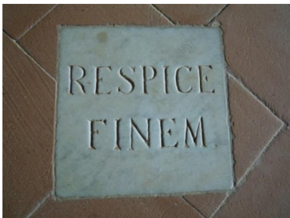
Tabella pavimentale moderna (Cappella del Papa, eremo di Camaldoli [AR])

In effetti, non diversamente dal morire 'bene', l' ars moriendi era presente alla cultura greca (fin da Platone) e romana – «prepariamoci a morire, prima che a vivere» scriveva Seneca 18 –, ma ebbe la sua grande storia nella tradizione giudaico-cristiana pre-novecentesca 19 . «Filosofare è imparare a morire» appuntava il 'senechiano' Montaigne attorno al 1580: «tutta la mia vita è stata soltanto perché imparassi a morire» affermò il rabbi polacco Simcha Bunamil, poco prima di chiudere gli occhi, nel 1827 20 .