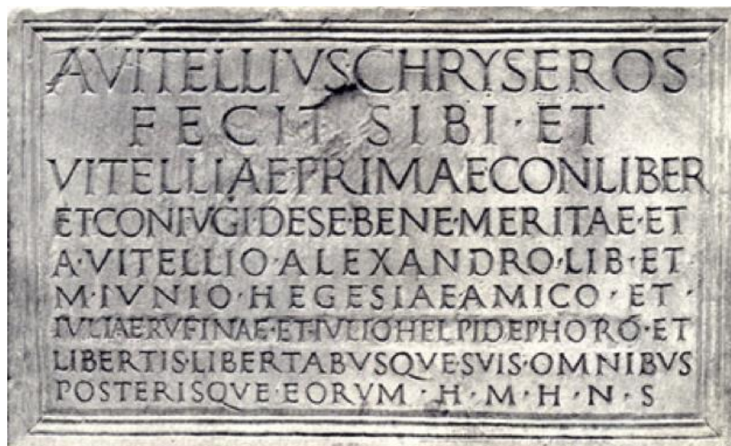
[CIL VI, 29080 = EDR133092 / Roma, seconda metà del I secolo d.C. / British Museum, London]