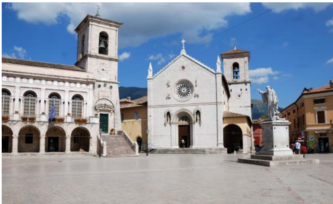
[Palazzo Comunale e Basilica di S. Benedetto (prima dei sismi del 24.8 e 26-30.10 2016)]

— la Basilica di S. Benedetto (la cui splendida memoria pre-sisma abbiamo voluto – non a caso – riprodurre qui di seguito e nella iconetta di questo lavoro), la concattedrale di S. Maria Argentea e il complesso della ex-chiesa di S. Francesco (dove si trovavano, tra l'altro, collocati l'Archivio Storico del Comune di Norcia e la Biblioteca Comunale San Benedetto); — il villaggio di San Pellegrino e la pieve medievale di San Salvatore di Campi, rispettivamente a sette e dieci chilometri dal capoluogo.