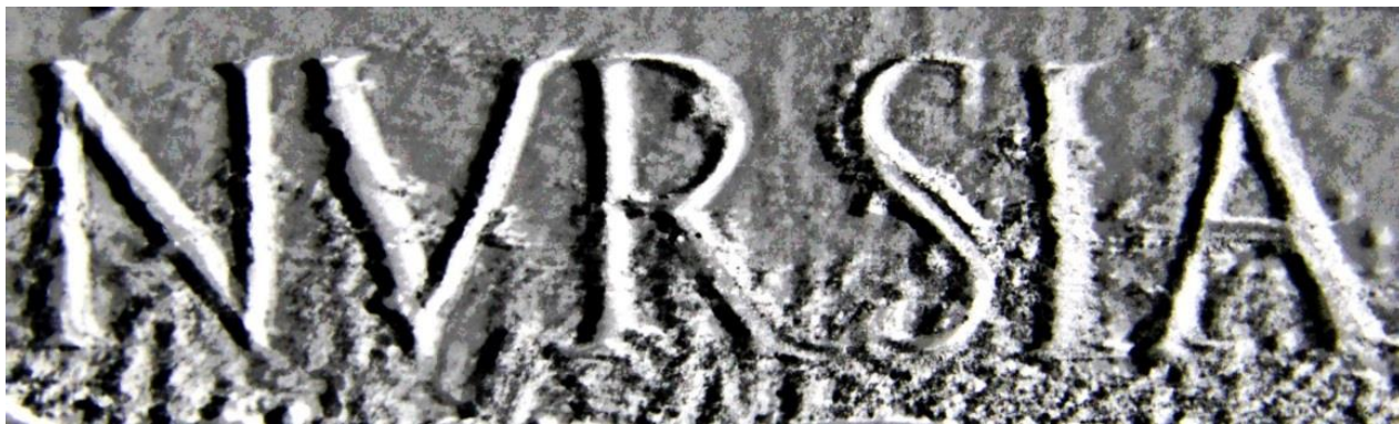
[particolare di epigrafe marmorea del II secolo d.C., reimpiegata come stipite del portale della collegiata di Sant'Emiliano a Trevi (PG) 11 ]