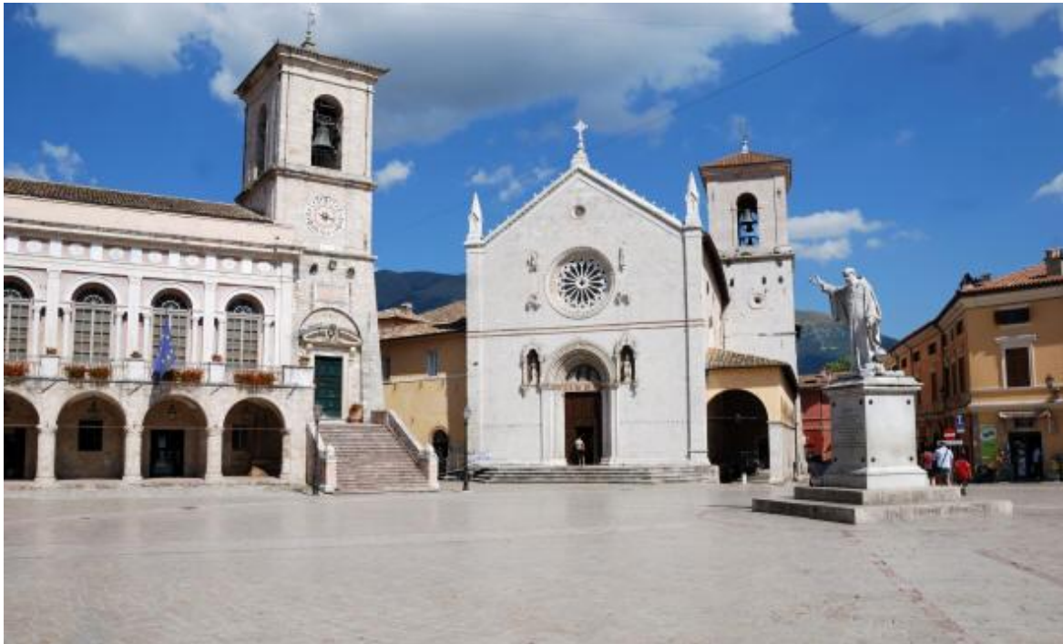
Norcia. Palazzo Comunale e Basilica di S. Benedetto (prima dei sismi del 24.8 e 26-30.10 2016)

— la Basilica di S. Benedetto (la cui splendida memoria pre-sisma abbiamo voluto – non a caso – riprodurre qui di seguito e nella iconetta di questo lavoro), la concattedrale di S. Maria Argentea e il complesso della ex-chiesa di S. Francesco (dove si trovavano, tra l'altro, collocati l'Archivio Storico del Comune di Norcia e la Biblioteca Comunale San Benedetto).