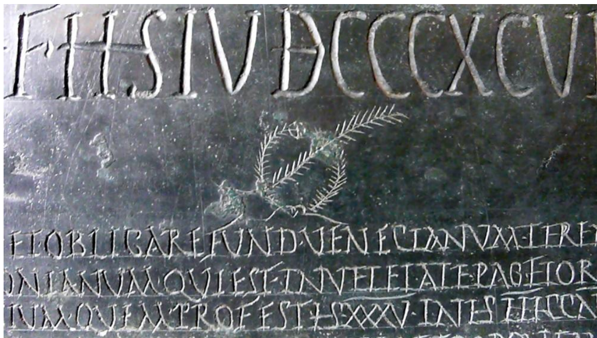
Tabula alimentaria di Veleia, particolare (Parma, Museo Archeologico Nazionale, Sala 5 ["veleiate"])

Su una superficie di 3,9 m 2 circa sono sgraffiti a solco triangoliforme senza apparenti strumenti di precisione (ma su sottili linee-guida orizzontali nelle colonne I – VI) più di 35.000 caratteri (40.000?), alti in media 0,7 cm – da 0,5 cm in fine riga, a 0,9 / 1,1 cm per le litterae longae – salvo che nelle tre righe della Praescriptio recens / Intestazione nuova [TAV A, 1-3, rispettivamente 4,2 / 3 / 2,3 cm]: per offrire un primo, quanto estemporaneo dato di confronto, in questa edizione risultano – con segni diacritici, scioglimenti, integrazioni, numerazione e titolini moderni – 64.288 caratteri, spazi esclusi; 73.777 caratteri, con gli spazi.