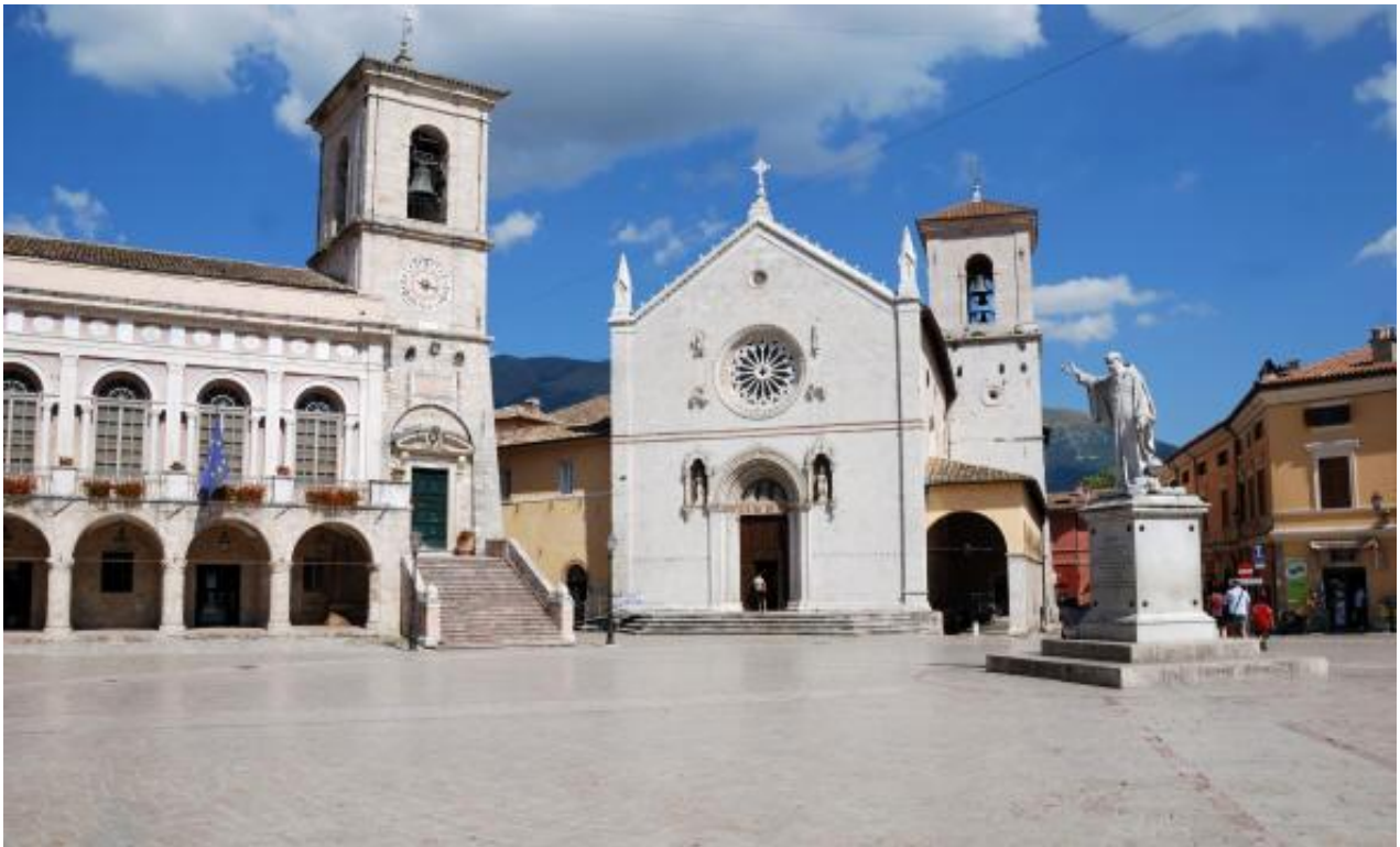
Norcia, Palazzo Comunale e Basilica di San Benedetto (prima degli eventi sismici del 24 agosto e 26-30 ottobre 2016)