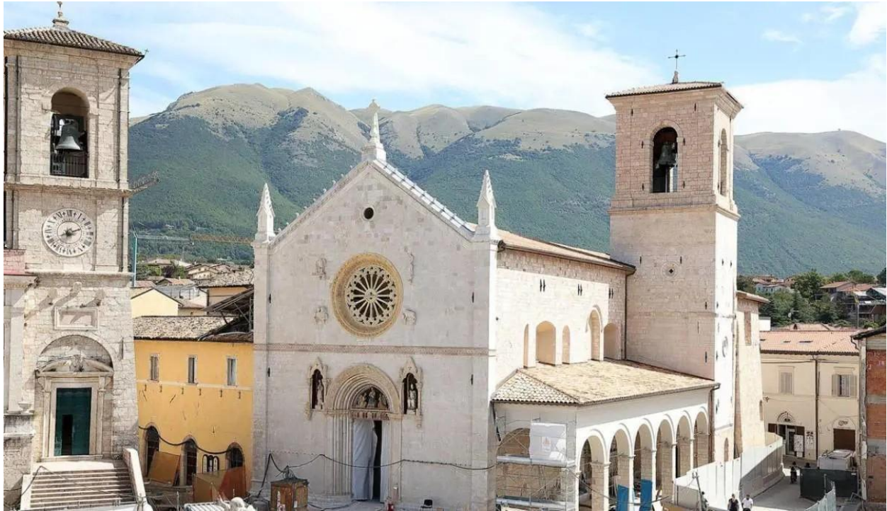
Norcia, Basilica di San Benedetto dopo la riapertura del 30-31 ottobre 2025 (a sinistra la torre civica del Palazzo Comunale, restaurata nel 2020)

— il complesso monumentale dell'ex-convento di S. Francesco (dove si trovavano collocati, tra l'altro, l'Archivio Storico del Comune di Norcia e la Biblioteca Comunale San Benedetto di Norcia).