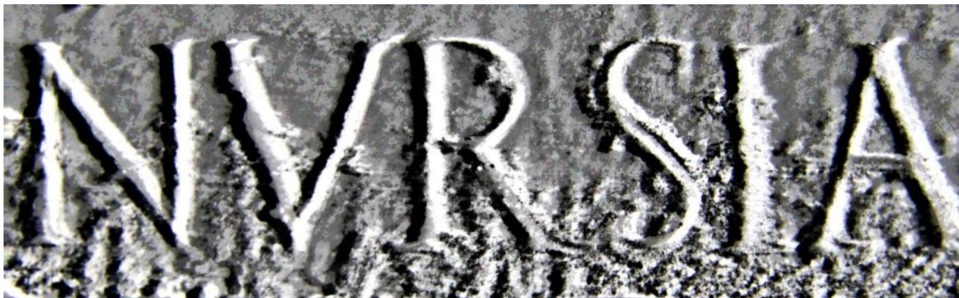
Particolare di epigrafe marmorea del II secolo d.C., reimpiegata come stipite del portale della collegiata di Sant'Emiliano a Trevi (PG) 13