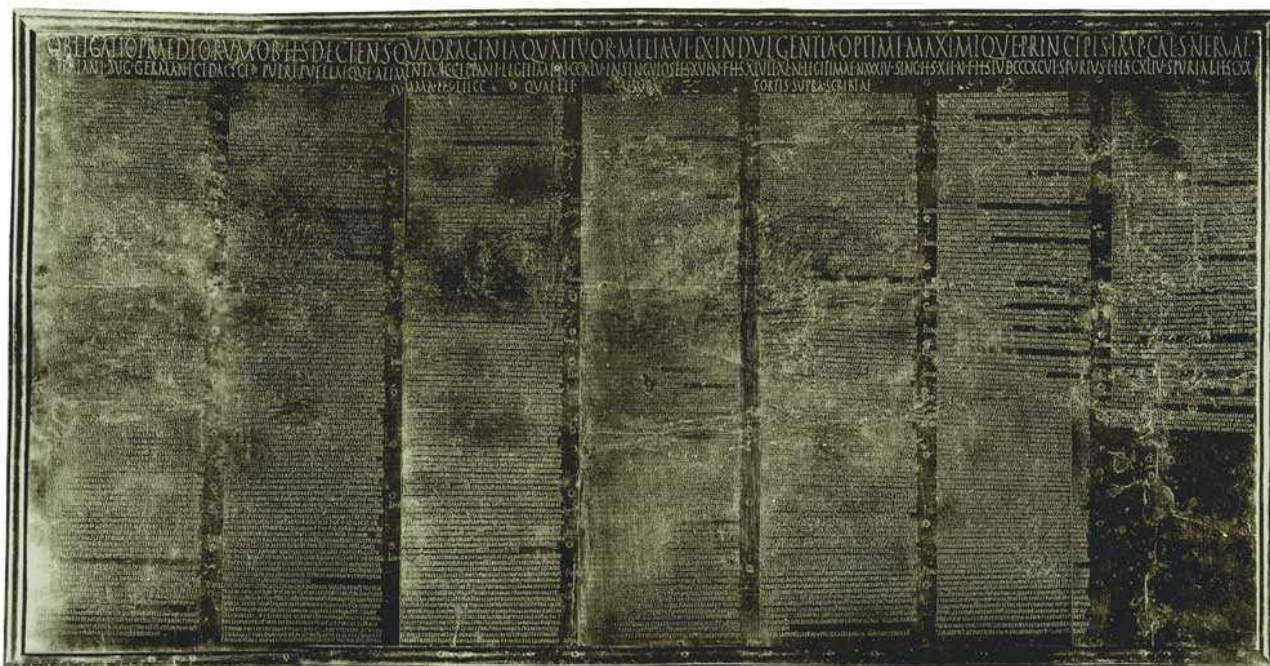
Tabula alimentaria (Basilica del Foro, Veleia / Museo Archeologico Nazionale di Parma, Sala 4)

Pure in questa sede, per maggiore e indubbia comodità e praticità, a fianco del testo "alimentario" traiano è stata inserita – grazie anche alla collaborazione informatica di Giuseppe Costa, del Gruppo di Ricerca Veleiate [GRV] – la versione italiana, sua apprezzata e inseparabile compagna, anch'essa rivista e aumentata.