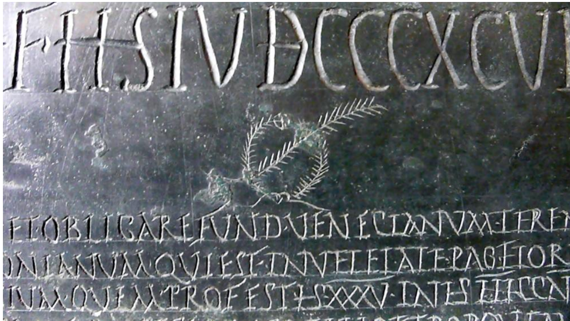
Tabula alimentaria di Veleia, particolare (Parma, Museo Archeologico Nazionale, Sala 4]

C. Nel suo insieme, la scrittura capitale del documento veleiate – opera di diversi artigiani locali – appare sostanzialmente corretta e attenta all'originale imperiale, legata parrebbe a un formulario grafico imposto dalla cancelleria del princeps : con inevitabili effetti di mano libera – fors'anche dovuti alla durezza del materiale bronzeo – per le minuscole, a volte inclinate, lettere delle sette colonne, e con qualche sciattezza, tuttavia, nella colonna III (vd. le anomalie morfologiche qui solo presenti) e nella V, la più imprecisa.